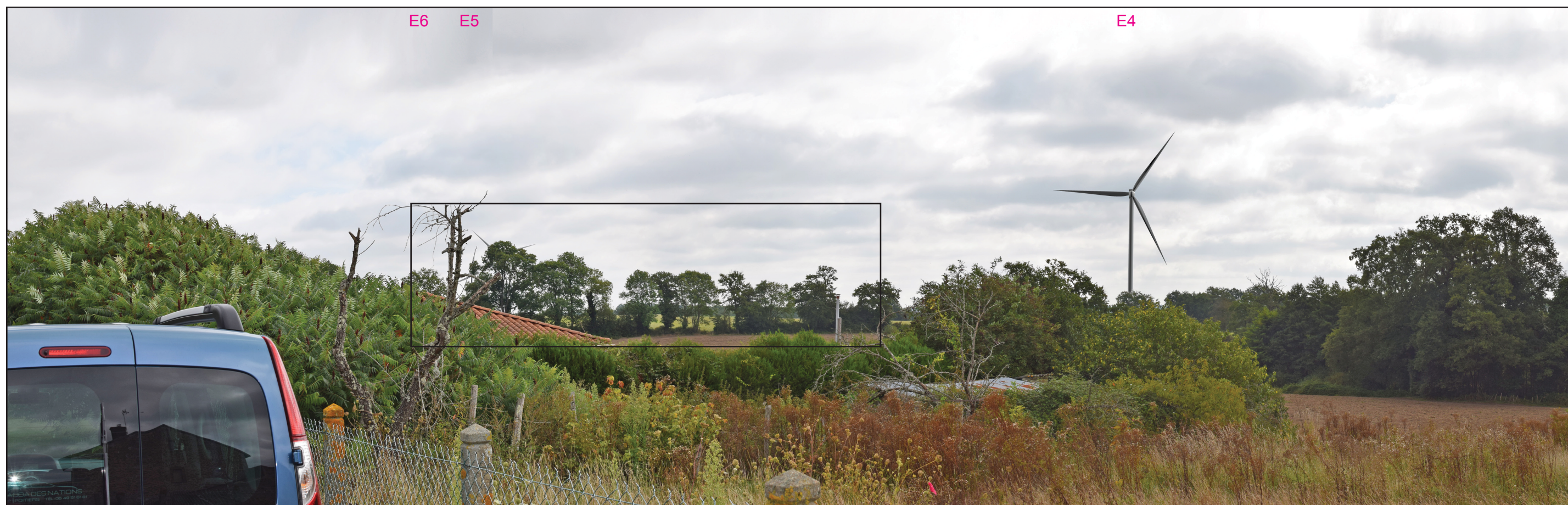
Vue réaliste photomontée (angle de vue 80°)

Le photomontage doit être observé à une distance de 24 cm pour correspondre à une vue réaliste (impression A3)